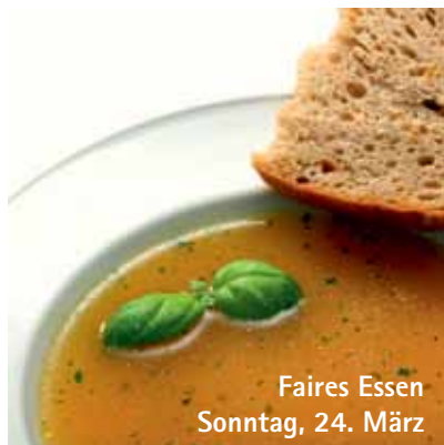
Faires Essen Sonntag, 24. März

Um 11:15 Uhr findet zudem ein Kinder-Erlebnisgottesdienst statt.