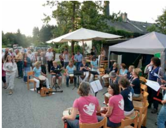
Die ökumenische Nacht der Musik fand bereits zweimal bei bestem sommerlichem Wetter statt. Auch heuer hoffen die Veranstalter wieder auf eine laue Sommernacht.